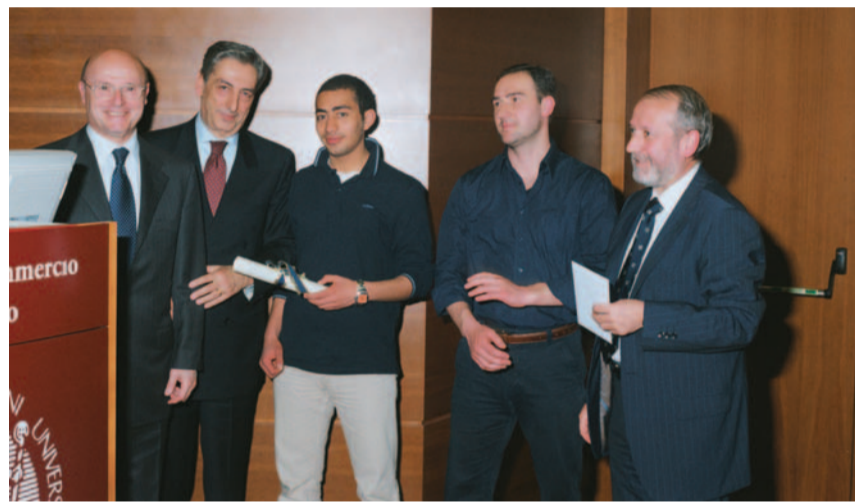
La premiazione dei due giovani studenti